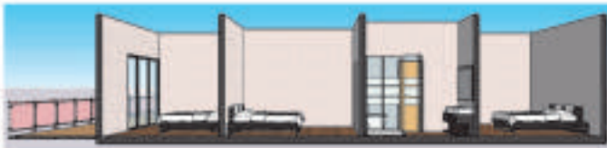
Corte - Recamaras