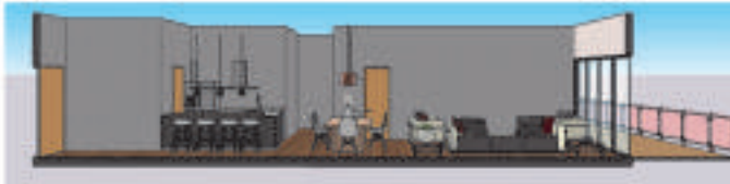
Corte - Cocina, Comedor, Sala